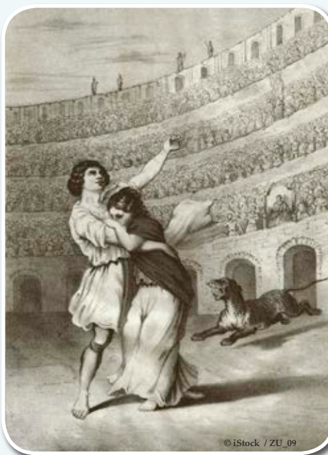
La persécution des chrétiens au temps de l'empereur Néron

Aujourd'hui encore, le livre aux Hébreux rappelle et indique avec force aux croyants juifs que Christ est supérieur à tout ce qu'ils avaient dans le judaïsme et qu'il est suffisant pour tout ce qui touche à leur vie spirituelle. Dans les trois premiers versets, l'auteur avance une preuve irréfutable que Jésus-Christ est Dieu et l'héritier de toutes choses.