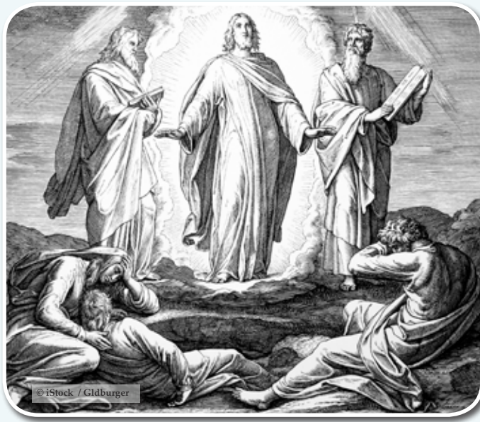
La transfiguration de Jésus avec Moïse et Élie

La révélation de Dieu est venue « à plusieurs reprises et de plusieurs manières » (v. 1). Entre Adam et le prophète Malachie, Dieu a progressivement révélé Son plan, Son programme et Ses desseins. Il a également parlé aux pères de « plusieurs manières » (v. 1). Il a souvent communiqué Sa révélation de façon directe à des hommes comme Abraham, Moïse, Ésaïe et Ézéchiël. Il a aussi parlé aux prophètes par des rêves et des visions. À d'autres moments, Il communiquait à travers la tempête, le feu ou d'une voix audible. L'Ancien Testament est la vérité divine exempte d'erreur, mais il n'est pas toute la vérité que Dieu allait révéler aux hommes. Ce qui fut révélé dans l'Ancien Testament représente le décor pour dévoiler la suffisance et la supériorité de Jésus-Christ, le Fils de Dieu. Quatre cents ans après l'achèvement de Sa révélation par le biais des Écritures hébraïques, Dieu allait poursuivre Sa révélation à l'humanité au travers de Jésus-Christ.